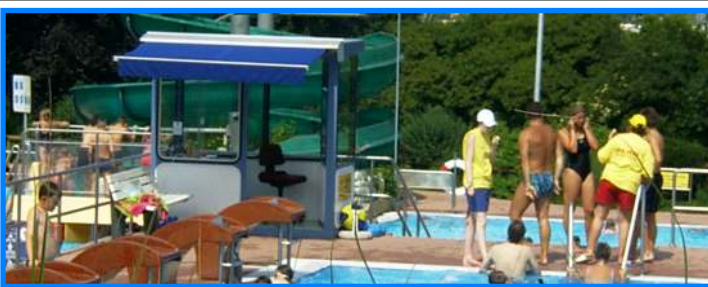
Wachdienst im Freibad Wendlingen