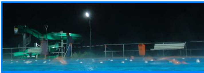
Nachts im Freibad beim 24-Stunden-Schwimmen

Veranstaltungen: Mitte Juli findet immer unser 24-Stunden-Schwimmen im Freibad statt. Hier kann einzeln oder als Mannschaft, egal ob Schule oder Verein, um die längste Strecke geschwommen werden.